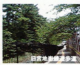
旧宮地線跡遊歩道