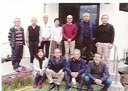
中川区自治会役員会のメンバー

今年度の重点活動として下記の5つの事項を推進していきますので区民の皆様のご参加・ご協力をよろしくお願いいたします。