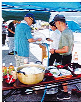
8月6日ソーメン流し

4月7日評議員会後、午後2時までサロン会を開催し、たくさんの方々に来館頂きました。