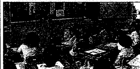
3年 相手の人格を尊重する取組