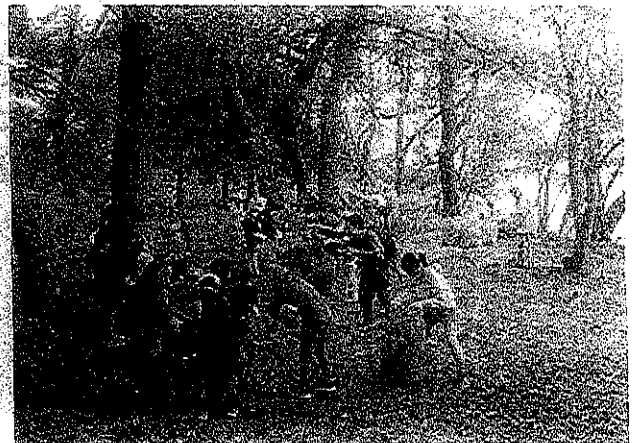
ねえ、これもうちよつと入るつちやない!