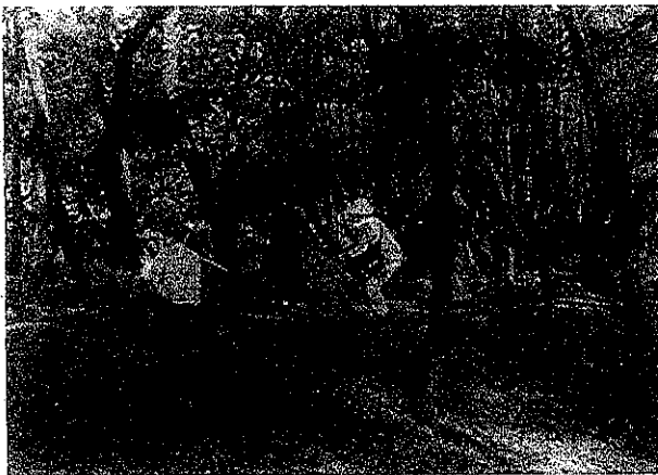
私が持っとくけん、これに入れんね!